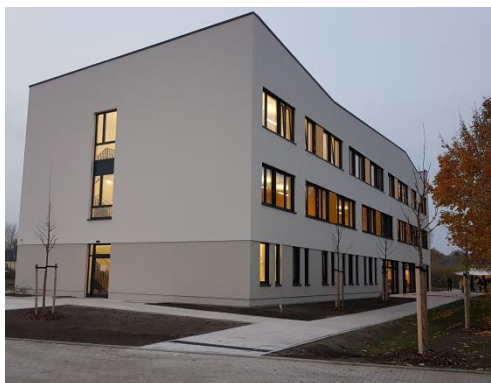
Pflegeschool der AGP GmbH in Nauen

Besuche uns auf: www.havelland-kliniken.de