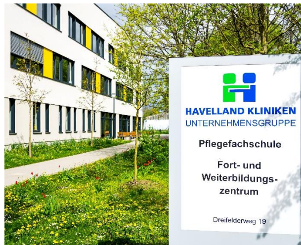
Pflegefachschule im Dreifelderweg 19 / 14641 Nauen

Der theoretische und praktische Unterricht findet an unserer modernen Pflegefachschule in Nauen statt.