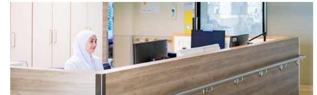
Bsp. moderne Station in Nauen

Die praktische Ausbildung in der Havelland Kliniken Unternehmensgruppe findet sowohl in den Praxen, wie auch in den Kliniken statt: