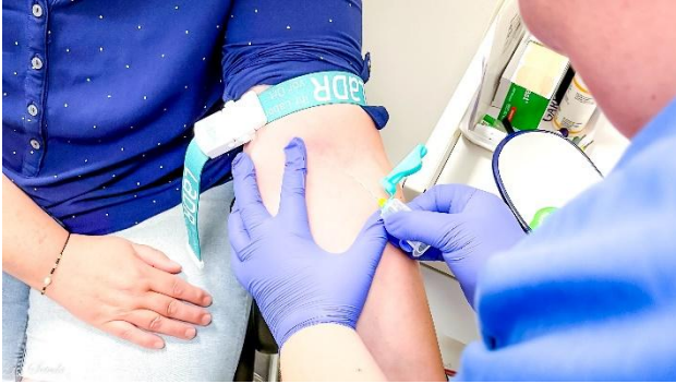
Bsp. Blutabnahme oder Impfen

Und? Jetzt Lust mit uns für die Gesundheit unserer Mitmenschen im Havelland zu arbeiten?