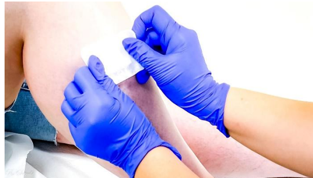
Bsp. schnelle Wundversorgung

Sie arbeiten auch in medizinischen Laboratorien, Aufnahme- und Belegungscentren, in der administrativen Aufnahme von Patienten und im öffentlichen Gesundheitsdienst.